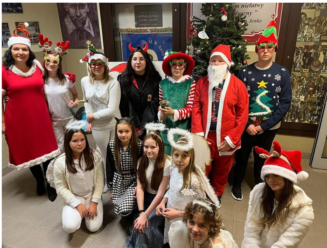
sesja mikołajkowa uczniów z klasy 8b

Dzięki wielkiemu zaangażowaniu uczniów z Samorządu Uczniowskiego, którzy utworzyli wyjątkowy Orszak ze Świętym Mikołajem na czele.